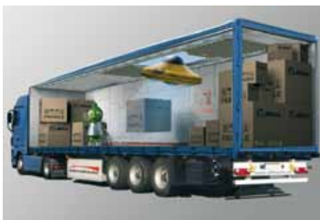
Grafické návrhy možného řešení. Vytvořené jen pro propagační účely.