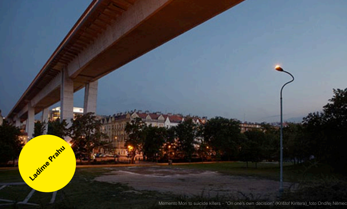
Memento Mori to suicide killers – "On one's own decision" (Krištof Kintera)