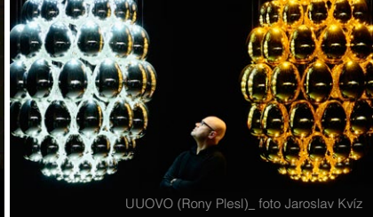
UUOVO (Rony Plesl)