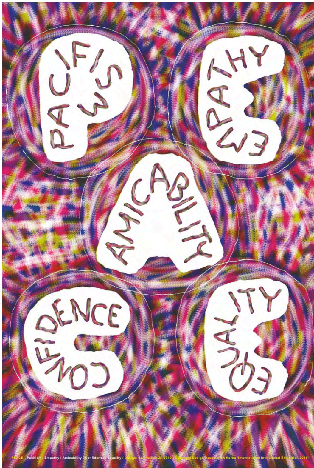
Jan Rajlich jr.: Peace – Pacifism, Empathy, Amicability, Confidence, Equality. Sociální plakát, ofset, 100×70, 2019

22. 4.–30. 6. 2023 / Foyer Univerzitního kina Scala, Moravské nám. 3/127, Brno