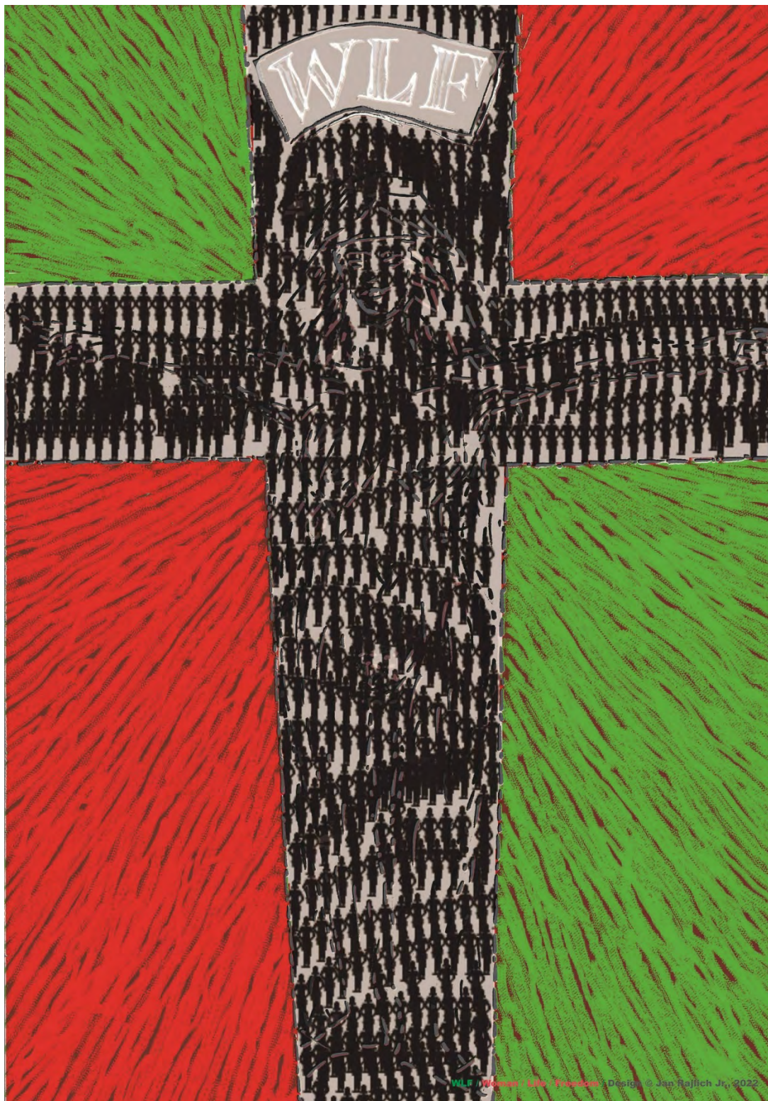
Jan Rajlich jr.: WLF / Woman / Life / Freedom. Sociální plakát, ofset, 100×70, 2022

22. 4.–30. 6. 2023 / Foyer Univerzitního kina Scala, Moravské nám. 3/127, Brno