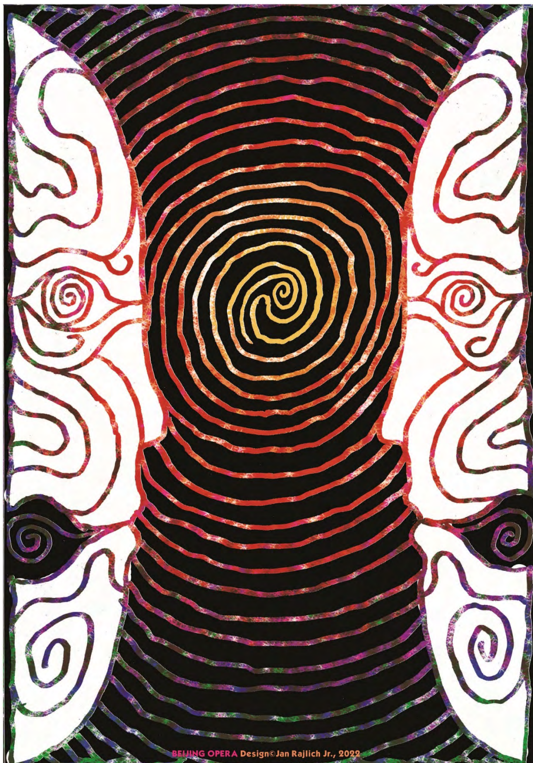
Jan Rajlich jr.: Beijing Opera. Kulturní plakát, ofset, 100×70, 2022

22. 4.–30. 6. 2023 / Foyer Univerzitního kina Scala, Moravské nám. 3/127, Brno