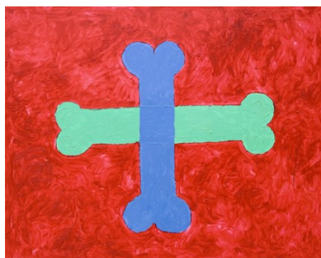
Alexi Goubarev, z cyklu À rebours