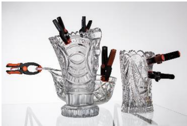
Proměna – sklo, re-design, 2012, výška 1–29 cm; Foto: archiv autora; fotografie jsou dostupné na vyžádání

Rozhovor s Jakubem Berdychem: http://www.materialtimes.com/tema-tydne/jakub-berdych-i-plastovy-kybl-je-zranitelny.html