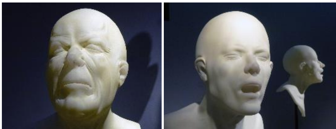
Untitled – foukané sklo, „Inside sculpting“; vlevo podle Franze Xaver Messerschmidta (1736 – 1783), 2013, výška 34 cm; vpravo Untitled z roku 2014, výška 38 cm; Foto: Tomáš Hendrych, fotografie jsou dostupné na vyžádání

„Inside sculpting“ – jdeš dovnitř, do bubliny...“