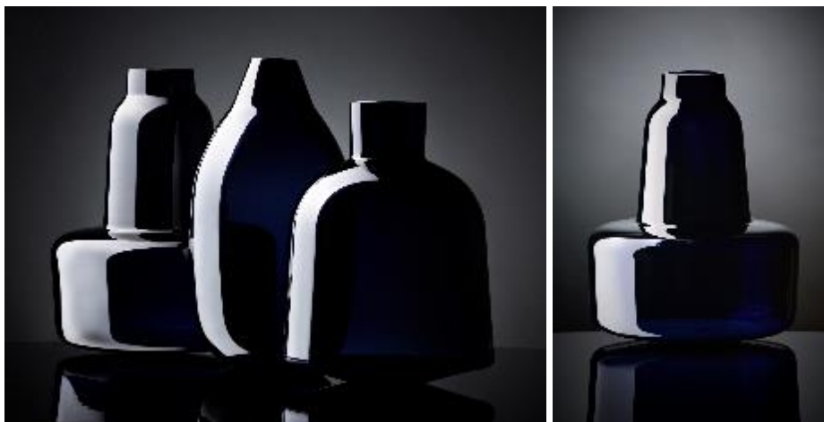
Bóje – barevně podjimané sklo, foukané do rotační formy, broušené, 2014, v= 30–39 cm, Ø = 20–26 cm; Foto: Jaroslav Kvíz, fotografie jsou dostupné na vyžádání

„Redukuji dávno existující, jdu k původní podstatě tvaru...“