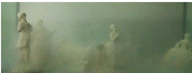
Design: Vendula Radostová; Foto: UMPRUM; fotografie jsou dostupné na vyžádání

Autorka pracuje s rozkladem, rozpadem, pomíjivostí, náhodou, destrukcí. Hledá nové formy a staré nechává zanikat. Nevypálené porcelánové sošky firmy Royal Dux