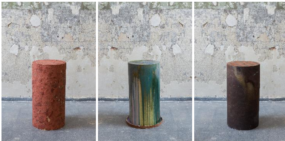
Design:Linda Vondrová; Foto: UMPRUM; fotografie jsou dostupné na vyžádání

Autorka pracuje se schopností lidské mysli vytvářet asociace a na jejich základě hledat spojitosti mezi různými aspekty lidského bytí a chování.