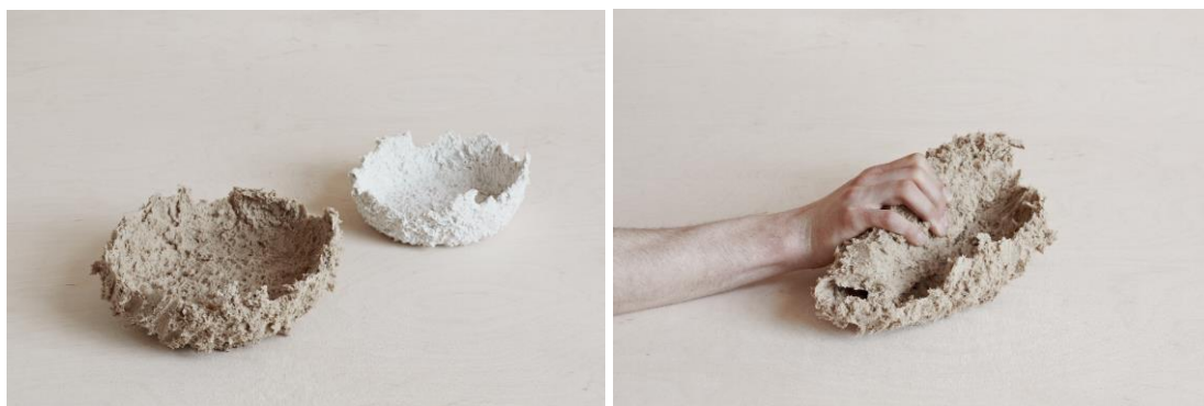
Design: Lucie Krylová; Foto: UMPRUM; fotografie jsou dostupné na vyžádání

Autorka pracovala s nápadem vytvořit šlehačkový porcelán. K zahuštění směsi sypkého porcelánu použila silikon, který umí dobře přilnout k dalším materiálům. „Rané pokusy, při kterých jsem chtěla docílit podobného nabývání hmoty, které můžeme díky tuku pozorovat při přípravě šlehačky, se nedařily. Ale během experimentování jsem zjistila, že směs je snadno odstranitelná z plastových mís, ve kterých jsem ji míchala.“ Díky tomu získala bez další práce formy. Autorka zároveň objevila několik technik zpracování experimentální hmoty. „Zdobičkou na těsto jsem vytvářela vlákna, která jsem rovnou vpuštěla do forem. Při jiném pokusu jsem vytvořila jedno dlouhé vlákno, se kterým jsem mohla plést či háčkovat. Vyzkoušela jsem i nanášení směsi na mísu, kde díky lepkavosti a přilnavosti silikonu vznikl zajímavý dekor.“