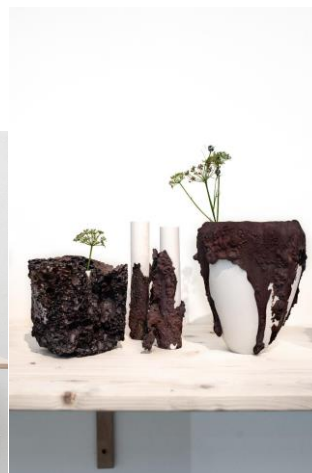
Design: Kristýna Plesková; Foto: UMPRUM; fotografie jsou dostupné na vyžádání

Autorka experimentuje s břidlicí, která se běžně využívá ve stavebnictví. Objevuje její možnosti a staví ji v kombinaci s porcelánem do nových souvislostí. „Zabývala jsem se momentem růstu a nekontrolovatelným bujením. Nechala jsem v peci porůstat porcelánové nádoby roztavenou břidlicí. Vznikly vázy, které v peci rostou, přetékají a mění svoji strukturu,“ říká Plesková.