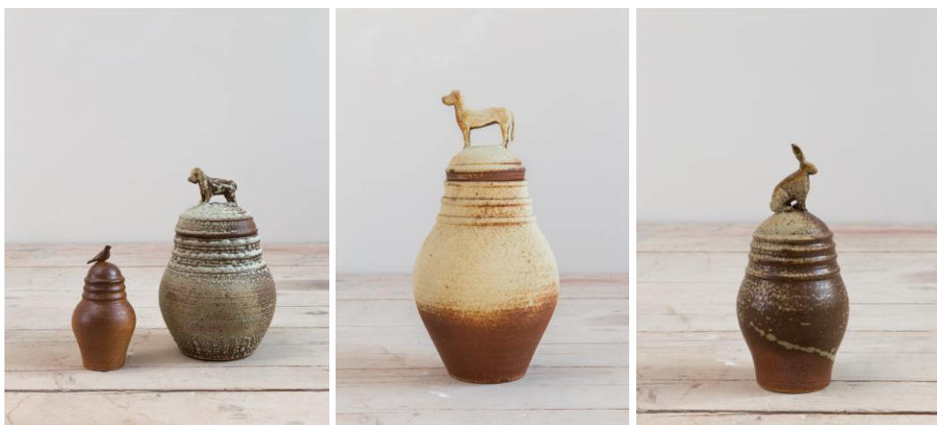
Design: Jana Štefková; Foto: UMPRUM; fotografie jsou dostupné na vyžádání

Autorka se zabývá důstojným uchováním památky zvířecích miláčků. Popel není obsahem nádoby, ale v podobě popelové glazury, která zušlechťuje povrch nádoby, se stává její součástí. Zpopelněné tělo zvířete se stává neoddělitelnou součástí vlastního relikviáře.