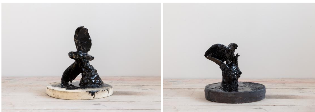
Design: Martina Kocmanová; Foto: UMPRUM; fotografie jsou dostupné na vyžádání

Křehkost bytí v podobě dravé zebřičky, která má vyvolávat strach.