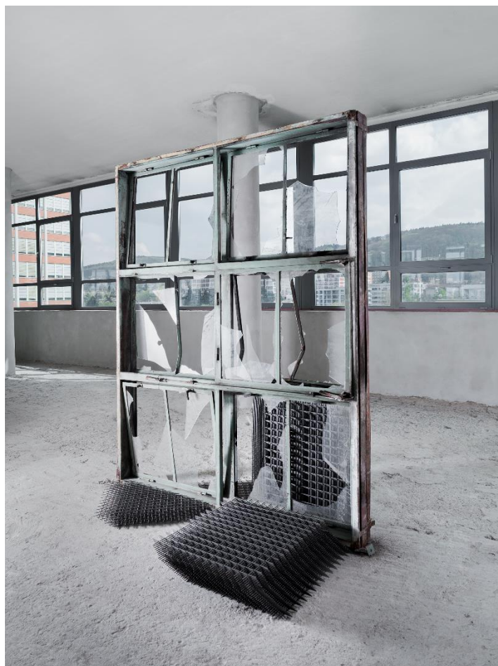
#25, sklo a kov, 2014.

Galerie Kuzebauch 16/12/2016 – 28/02/2017