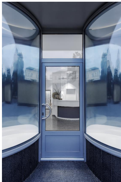
Dvě čočky, nerezový plech, 2016.

Partnerem galerie Kuzebauch a výstavy je Muzeum skla a bižuterie v Jablonci nad Nisou