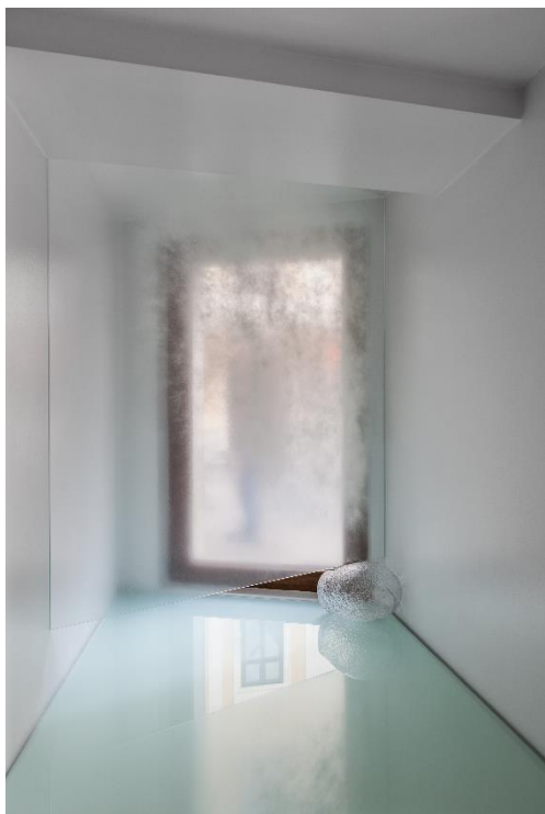
Rozhraní, sklo, 2013.